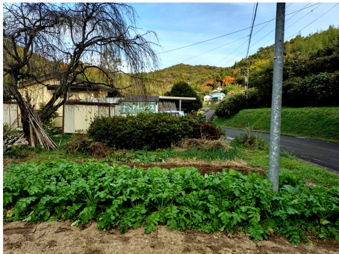
ベテルハウス（撮影：11月）