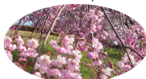
— 渋谷 敬一協力牧師

でも解ることは聖書が教えているようにあらゆる存在の本源として生きている霊なる全知全能の神がいるとしなければ、自然や人間を含む宇宙、万物の存在は無意味な底なし暗黒の空洞になると思うのです。神がいると信じる人には神が存在し、神がないと信じる人にはいないと言うものではありません。聖書は「愚かな人は心の中に神はいないと言い、その心は腐りはてている」(詩 14:1-3)と語ります。人間が神の存在を信じる信じないにかかわらず唯一の無限の霊なる神が存在します。神はいます"を前提として神存在をあらゆるものの出発点とします。神信仰が私の生き死にに関わるほどに重要なのは、そのことが"人はなぜ生きる"の根本的答えであるからです。「信仰がなくては、神に喜ばれることは出来ません。なぜなら、神に来る者は、神のいますことと、ご自身を求める者に報いてくださることとを、かならず信じるはずだからです。」(ヘブル11:6)